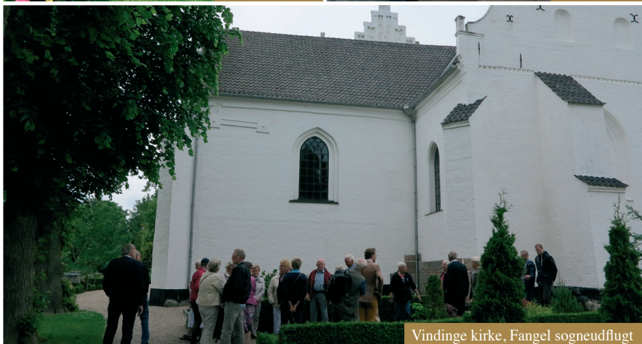
Vindinge kirke, Fangel sogneudflugt